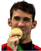
Michael Phelps - Nageur

28 médailles olympiques, 23 en or, 23 titres de champion du monde