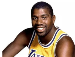
Magic Johnson - Joueur de basketball

5 titres NBA avec les Lakers Seul rookie à avoir été élu MVP des finales dans l'histoire de la NBA en 1980, 1982 et 1987.